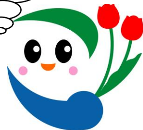
五泉市マスコット 「いずみちゃん」