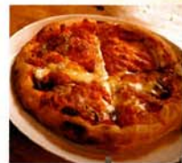
ピザ ¥890 (税込)

自慢のピザは分厚いもちっとした生地が特徴です。店の外には宮沢賢治のお話をモチーフにしたオブジェが。