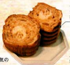
メープルラウンド (ハーフ) ¥230 (税込)

五泉市民が愛するパン屋さん。人気のメープルラウンドのほか「コーヒーパン」「バターエイト」「ヤングフランス」などレトロなネーミングが郷愁を誘います。