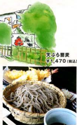
天ぶら蕎麦 ¥1,470 (税込)

注文を受けてから職人が打つ蕎麦は、風味を逃がさない石臼挽き。遠方からの客も多く、人気は「天ぶら蕎麦」。繊細な風味の蕎麦と天ぶらが絶妙です。