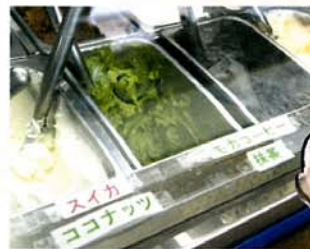
塩ジェラート ¥260 (税込)

冬季はふんわり生地のアラモード焼、夏季はジェラートで賑わうお店。県北笹川流れの塩を使った塩のジェラートがユニーク!