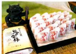
鬼の金棒 10本入 ¥950 (税込)

新食感と評判の「鬼の金棒」は、表面のカリッとしたりかんとんと、あんこの甘みが見事にマッチ。この濃さがたまりません。