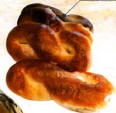
コーヒーパン ¥105 (税込)