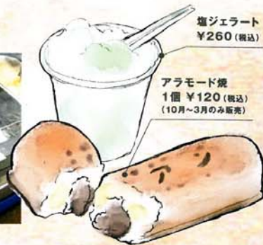
アラモード焼 1個 ¥120 (税込) (10月~3月のみ販売)