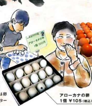
アローカナの卵 1個 ¥105 (税込)

鶏舎が隣接するショップでは新潟地鶏や烏骨鶏のほかに青・桃色・双子など珍しい卵がお出迎え。ふりふりの黄味は卵かけごはんにもオススメ。リピーター多数、地方発送もしてくれます。